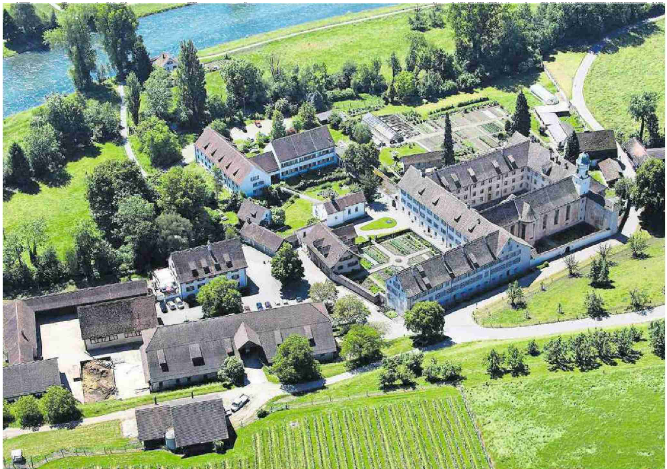
Das Kloster Fahr liegt bei Dietikon in der Nähe von Zürich.