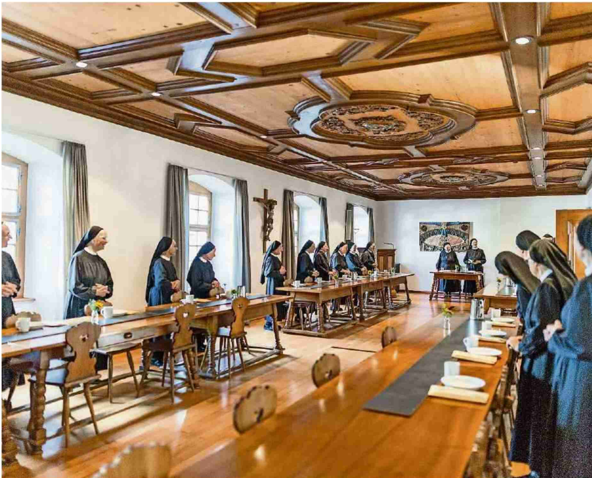
Setzen auf Hilfe aus Freikirchen-Kreisen: Die Benediktiner-Schwestern vom Kloster Fahr.

Auftrag: 1014270 Themen-Nr.: 140.005 Referenz: 72030781 Ausschnitt Seite: 3/3